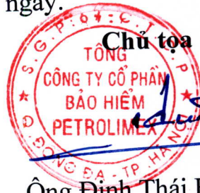
Ông Đinh Thái Hương